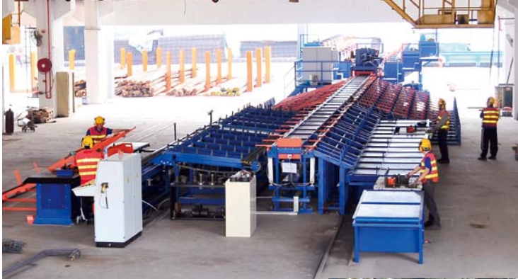
香港大埔之鋼筋增值加工中心