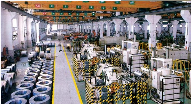
國內廣東省東莞之卷鋼加工中心