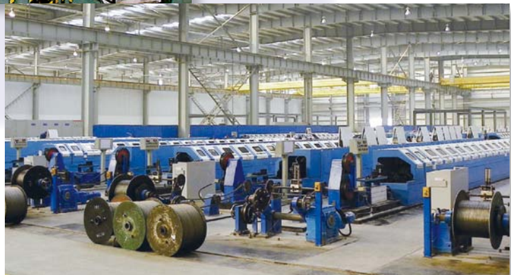
國內天津之電梯鋼絲繩生產線