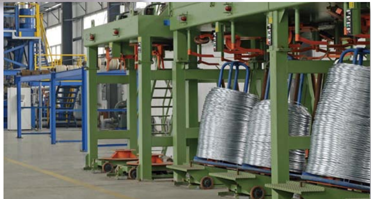
國內廣東省鶴山之鍍鋅鋼絲生產線